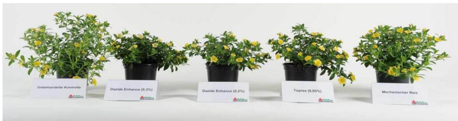
Abb. 2: Wuchsregulation Calibrachoa 'Aloha Double Citric' (Dümmen) - von links nach rechts: Kontrolle, Dazide Enhance 0,3 %, Dazide Enhance 0,2 %, Toprex 0,05 % (jeweils mit 5 l / Ar) und mechanischer Reiz mit 92 Behandlungen/Tag