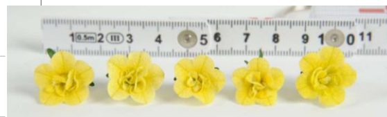
Abb. 1: Blütenaufhellungen beim Einsatz von Dazide Enhance (von links nach rechts: Kontrolle, Dazide 0,2 %, Dazide 0,3 %, Toprex 0,05 % und mechanischer Reiz)