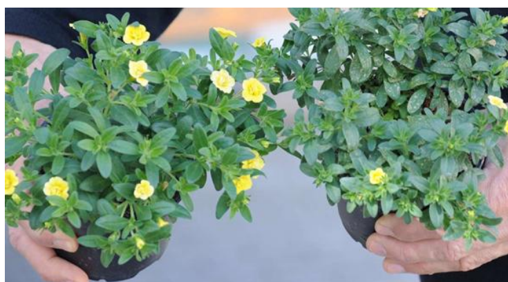
Abb.3: Kein Thripsbefall in der Reiz-Variante (Pflanze links). Alle anderen Varianten zeigten Saugschäden