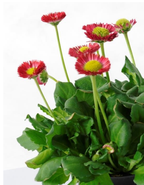
Abb. 1, 2 und 3: 'Rusher Exp. Rot' (Florensis) – vereinzelt waren in der Kontrollvariante leichte Blattrandchlorosen zu erkennen, die Pflanzen der Trockenstressvariante zeigten keine Symptome